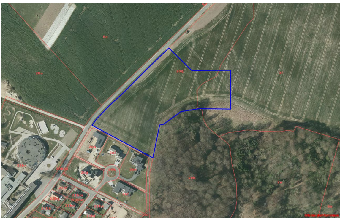
Afgrænsning af kommuneplantillæg.

I forbindelse med kommuneplantillæg nr. 26 udarbejdes lokalplan 1145 som sikrer områdets anvendelse til åben-lav boligbebyggelse. Lokalplanen vil samtidig sikre grønne fællesarealer, stiforløb ud mod skoven, veje og parkeringsforhold samt regnvandshåndtering. Desuden sikrer lokalplanen, at området overføres fra landzone til byzone.