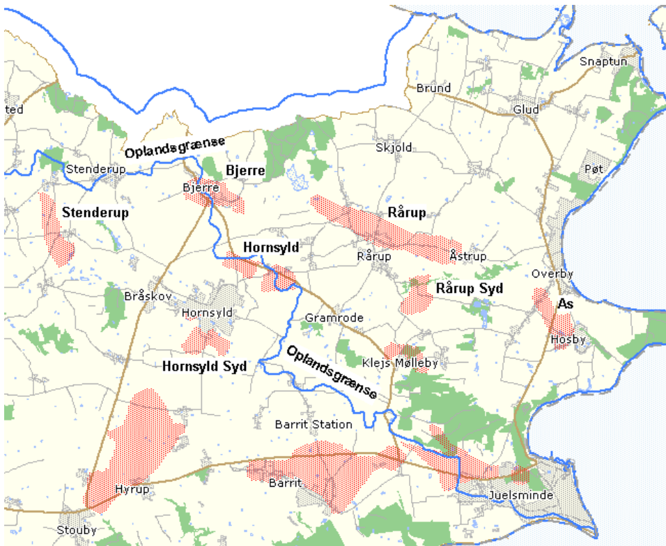
Figur 23. Indsatsområderne (røde) beliggende indenfor oplandet til hhv. Kattegat i øst og Vejle Yderfjord i vest. Den blå streg markerer oplandsgrænsen mellem Kattegat og Vejle Fjord.

Dette betyder, at den fulde effekt af vandplanerne kun kan tillægges på de arealer, som afvander til Vejle Yderfjord. For arealerne, som afvander til Kattegat, kan der tillægges en reduceret effekt af baseline. Dette forhold har væsentlig betydning for implementeringen af indsatsplanens mål i husdyrreguleringen, se senere afsnit.