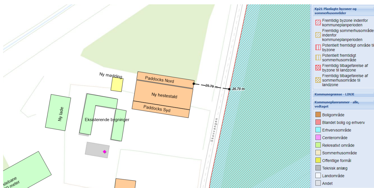
Figur 2: Aktuelle afgrænsning, "fremtidig byzone" jf. kommuneplan 2021-2033

Med det ansøgte, vil afstandskravet til fremtidig byzone jf. husdyrbruglovens §6 ikke kunne overholdes. Der vil ifølge kommunens opmålinger via GIS være ca. 25 meter til fremtidig byzone, se figuren herunder: