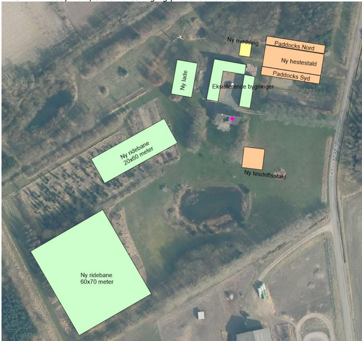
Figur 1: Oversigt over husdyrbruget og det ansøgte.

Figur 1 viser ejendommen i sin helhed, med placering af stalde, gødningsoptager, driftsbygninger m.v.