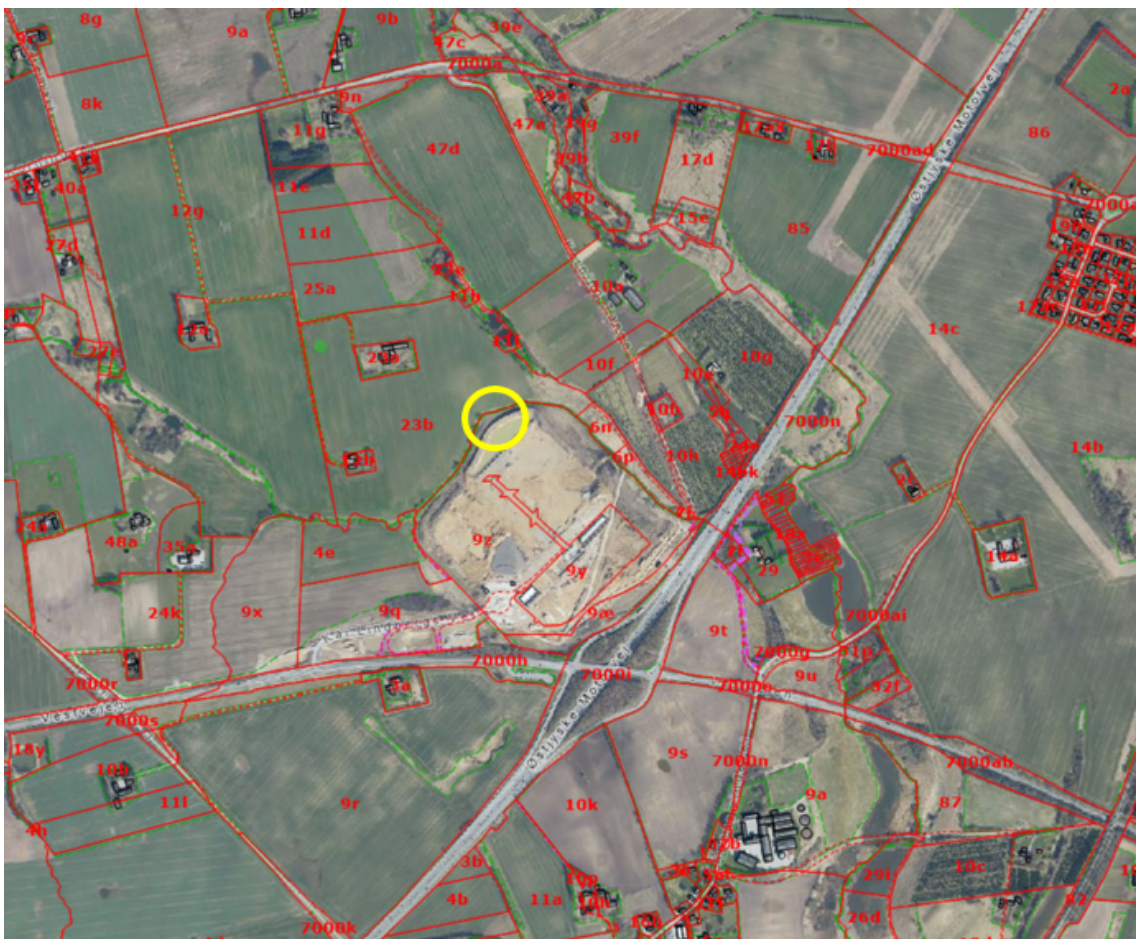
Luftfoto fra 2023 viser hvorpå ejendommen denne afgørelse vedrører.

Afgørelsen vil så vidt muligt blive offentliggjort tirsdag den 4. juni 2024 ved annoncering på Hedensted Kommunes hjemmeside