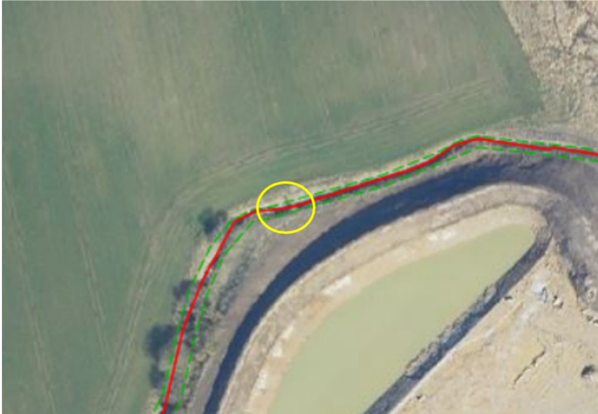
Luftfoto fra 2021 viser den omtrentlige placering af det ansøgte på ejendommen