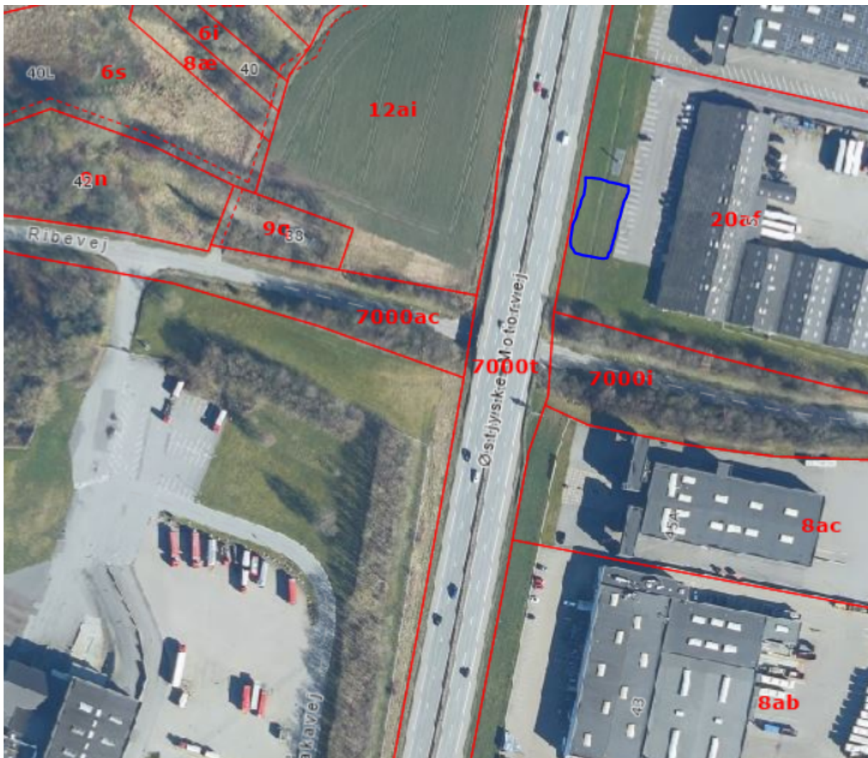
Luftfotoet viser projektområdet ved Ribevej, hvor oplagsområdet er markeret med blå.