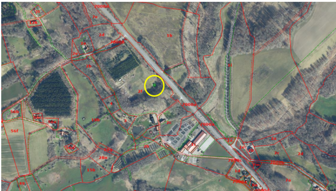
Luftfoto fra 2024 viser ejendommens placering i landskabet

Afgørelsen vil så vidt muligt blive offentliggjort tirsdag den 18. juni 2024 ved annoncering på Hedensted Kommunes hjemmeside