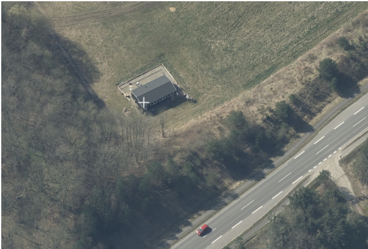
Skråfoto af fritidshus set fra nord/øst