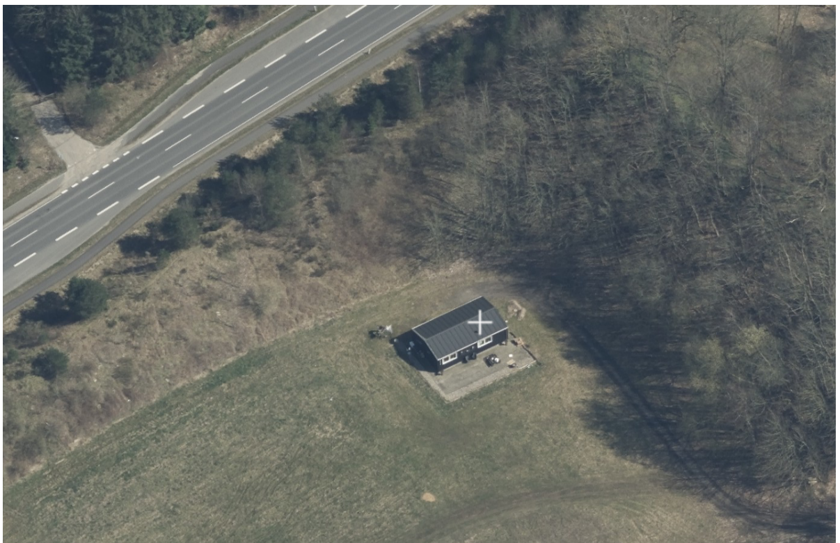
Skråfoto af fritidshus set fra nord/vest

Relevante tegninger fra ansøgning er sat ind herunder: