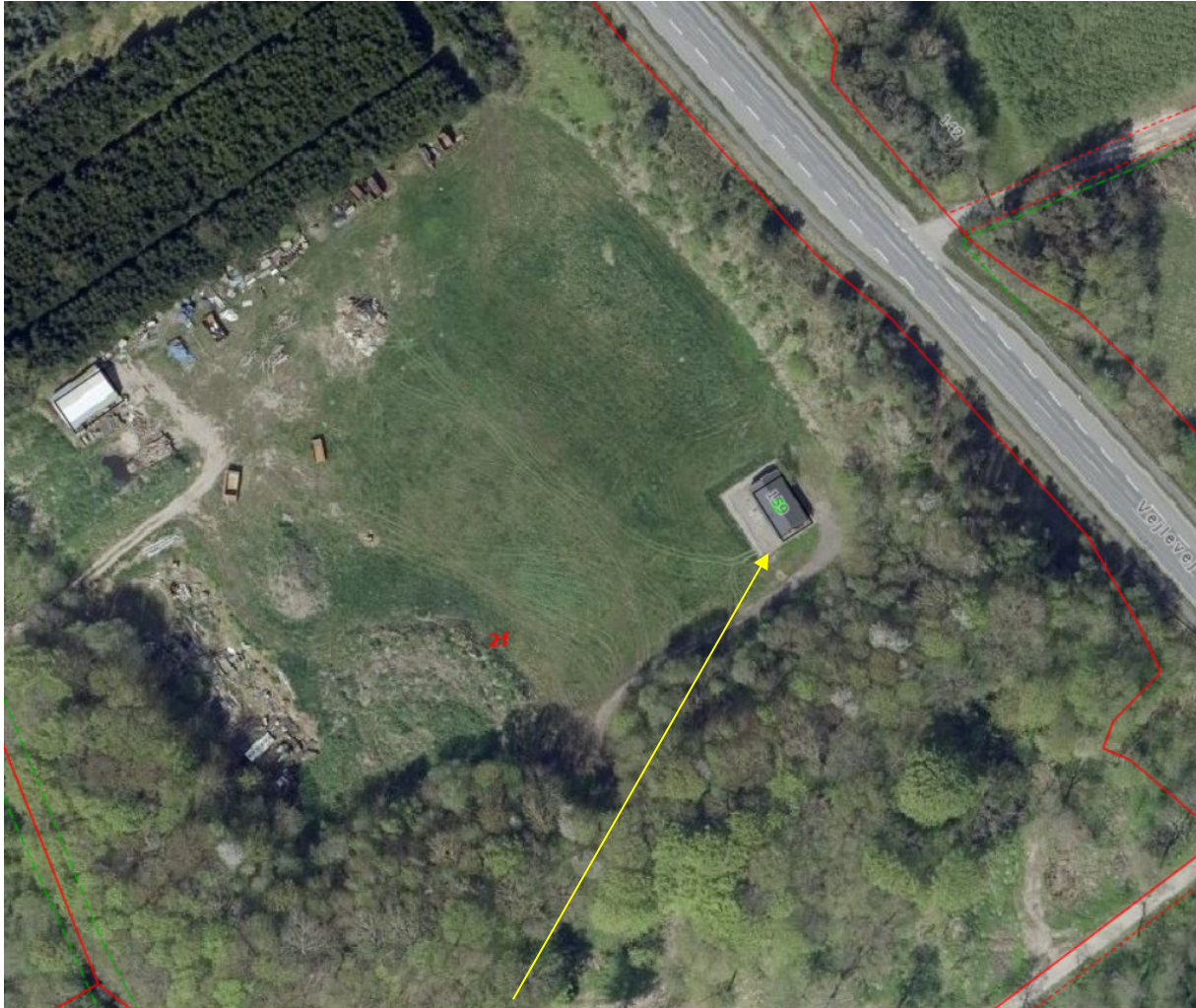
Luftfoto fra 2024 viser placeringen af det ansøgte på ejendommen

Fritidshusets facader er opført med træbeklædning og taget er tækket med tagpap. Fritidshuset er ca. 3,2 meter højt målt fra naturligt terræn.