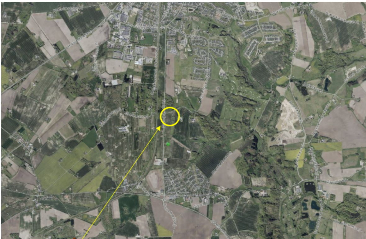
Ansøgtes placering i landskabet vist på luftfoto fra 2024.

Afgørelsen vil så vidt muligt blive offentliggjort torsdag den 20. juni 2024 ved annoncering på Hedensted Kommunes hjemmeside