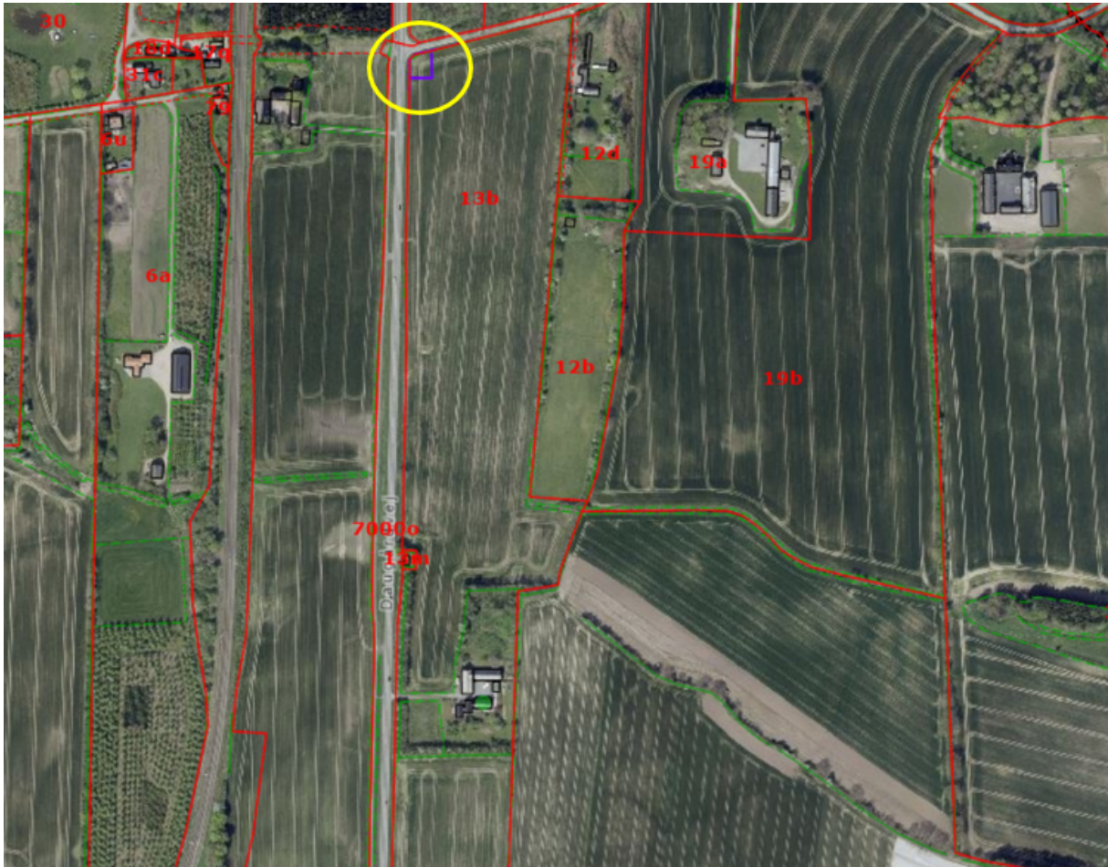
Placering af den ansøgte matrikel, vist på luftfoto fra 2024

Der er ansøgt om tilladelse til udstykning af et areal til ændret anvendelse fra landbrug til pumpestation. Pumpestationen vil være beliggende på en selvstændig ejendom/matrikel.