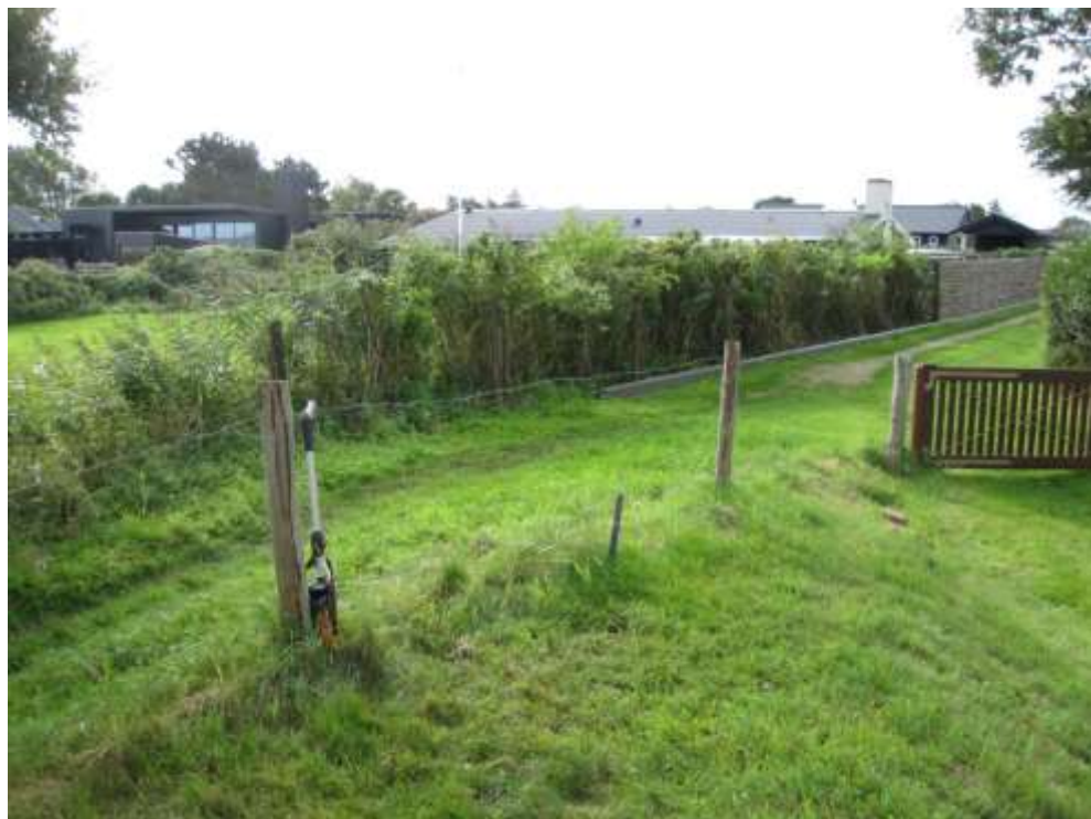
Set mod sydvest