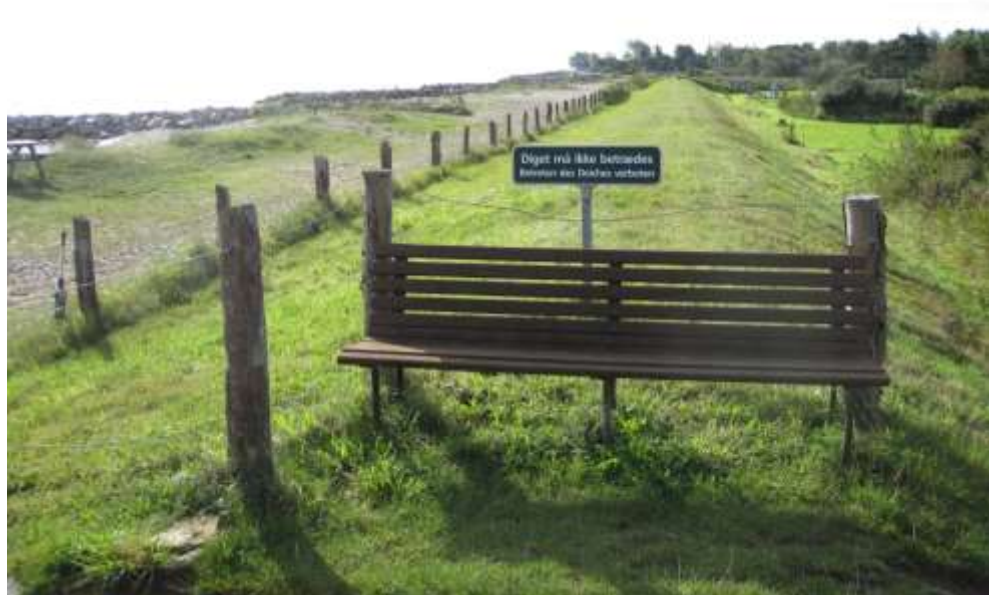
Set mod syd