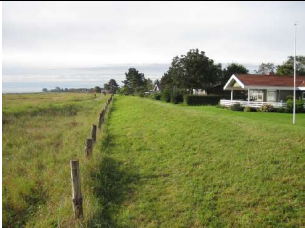
Set mod syd