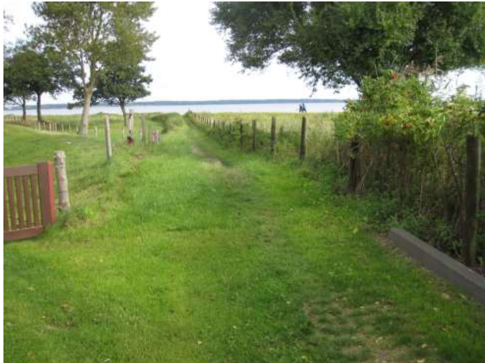
Set mod øst

Græsdækket overgang/vej til stranden. Diget sluttet her i kanten af grunden Bjørnsknudevej 55.