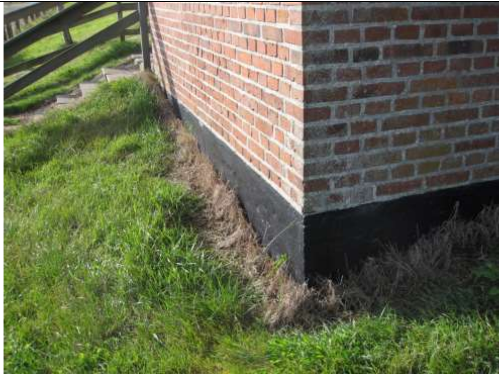
Set mod syd – østside