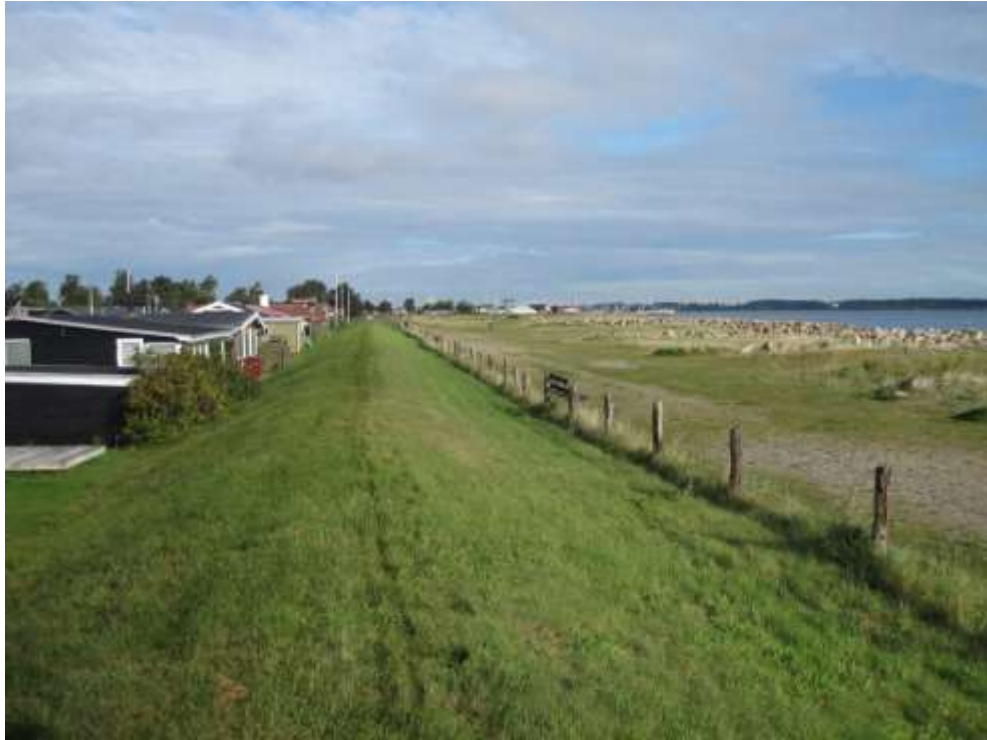
Set mod nord