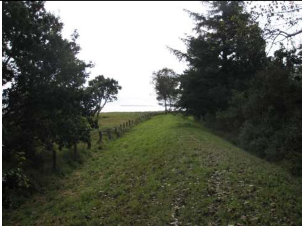
Set mod syd