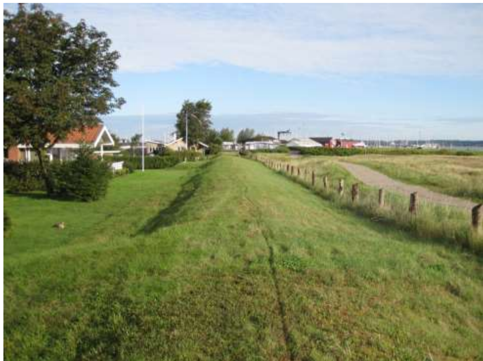
Set mod nord