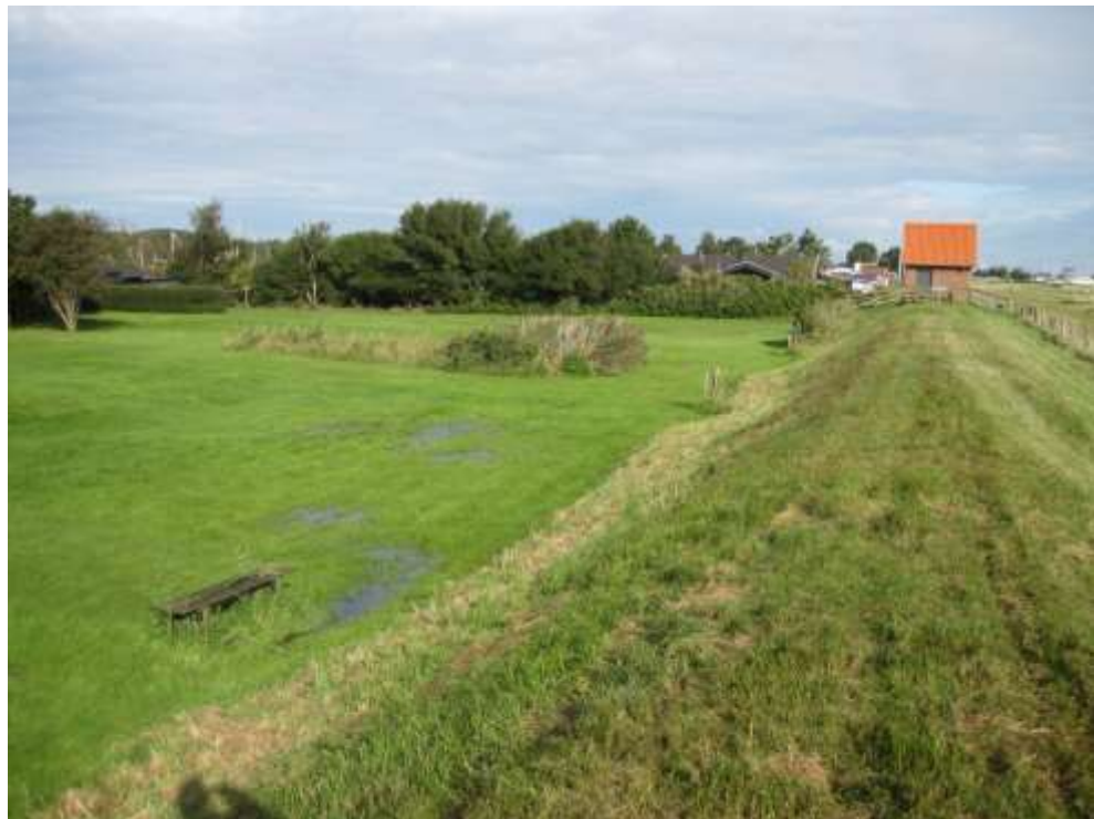
Set mod nord