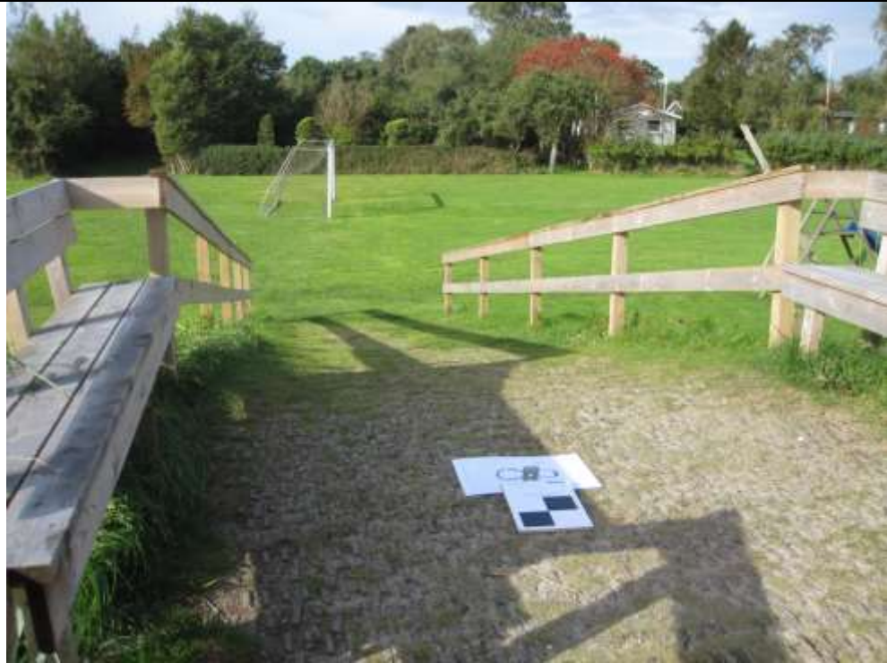
Set mod vest