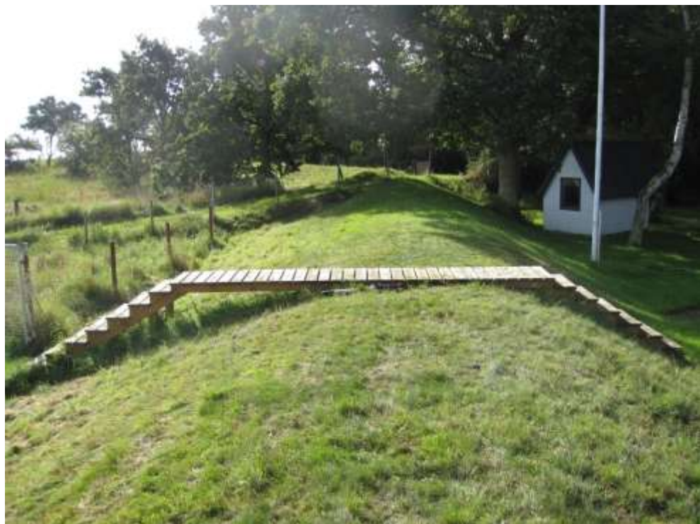
Set mod syd