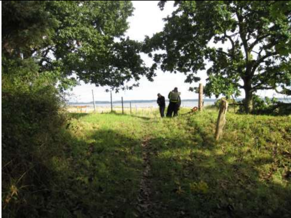
Set mod øst