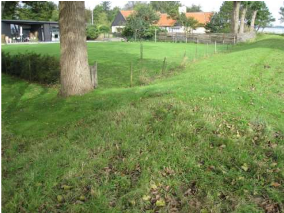
Set mod nord