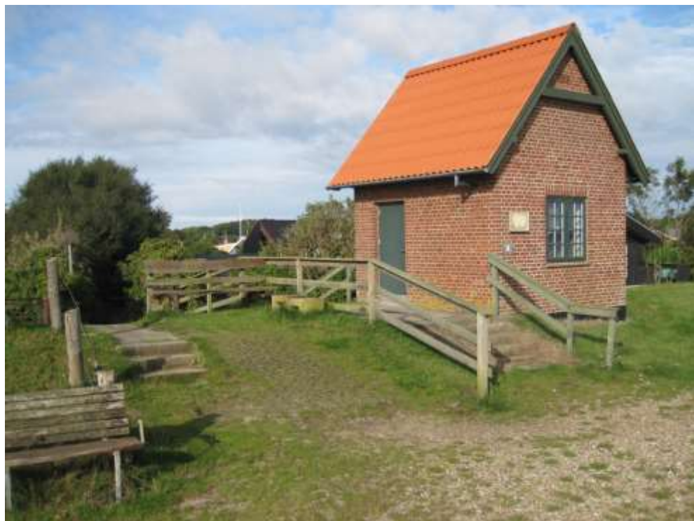
Set mod vest

Overgange med fliser/armeringsfliser og flisetrapper