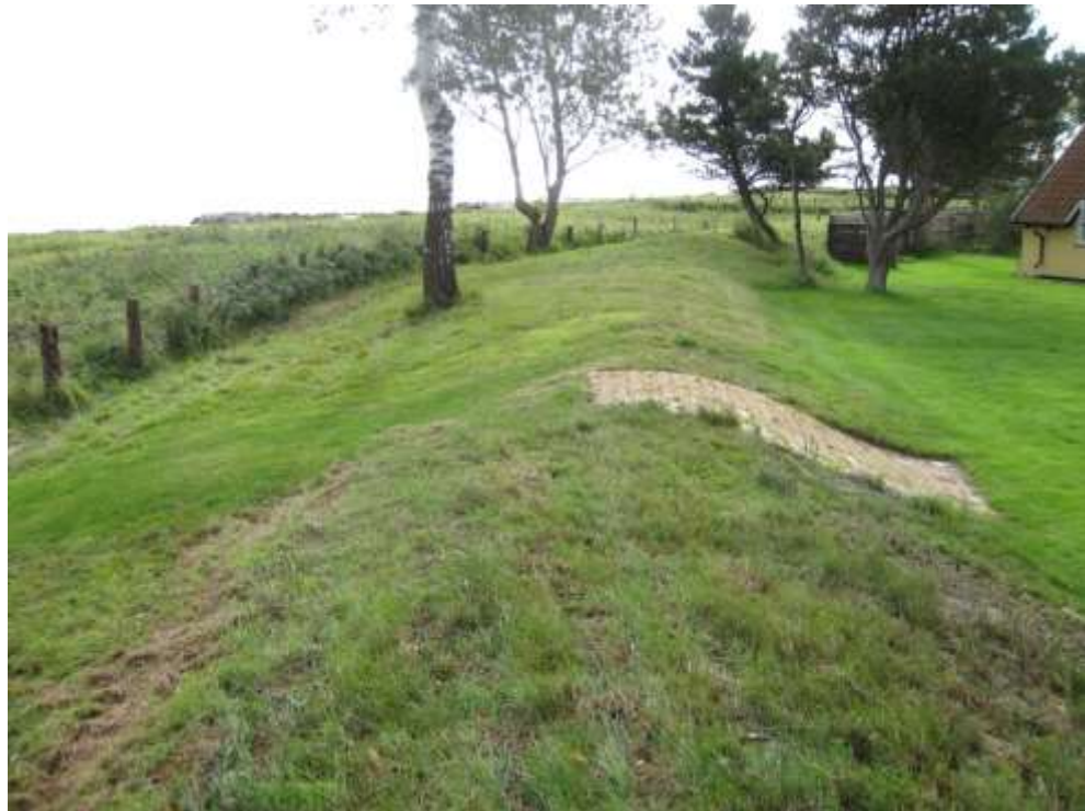
Set mod syd

Overgang udført med teglsten på bagsiden af diget. Græsset klippes tæt og er derfor ikke så filtet som andre steder på diget. Mindre sætninger på forsiden af diget.