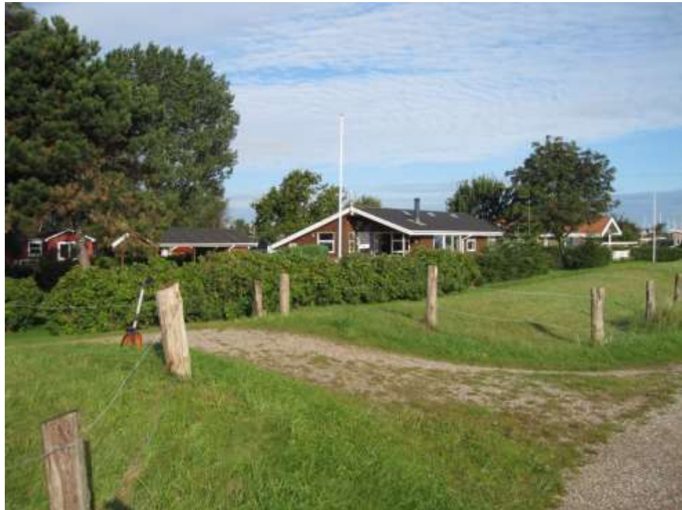
Set mod nordvest

Grusbelagt overgang af diget. Overside i samme højde som omkringliggende dige.