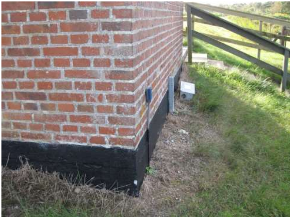
Set mod syd - vestside