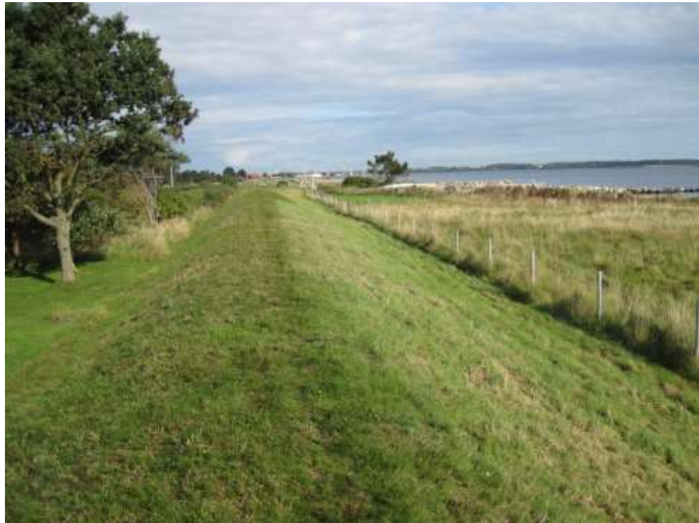
Set mod nord