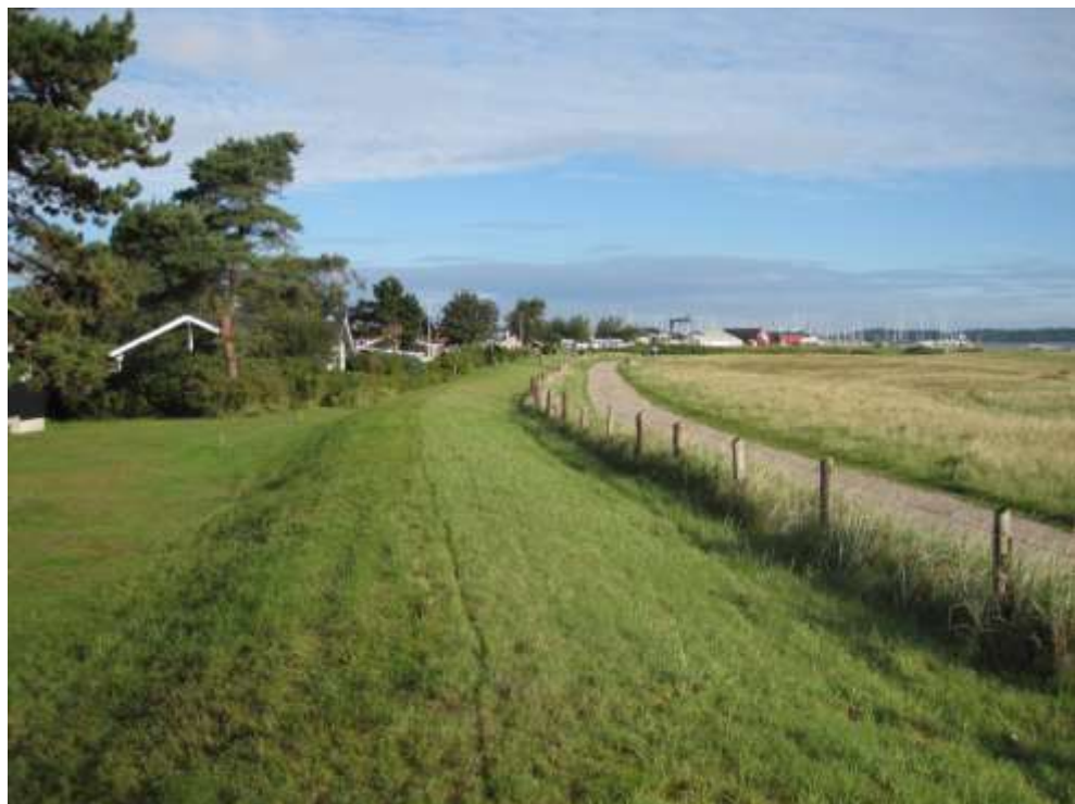
Set mod nord