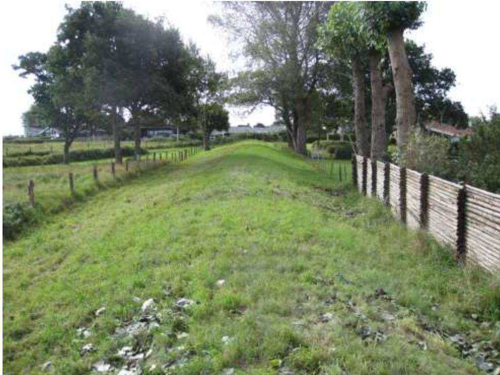
Set mod syd

Diget klippes tæt på strækningen ca. meter 1332 -1360 og er derfor ikke så filtet som andre steder på diget.