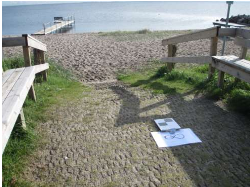
Set mod øst