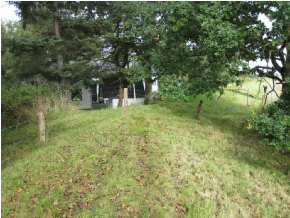
Set mod nord