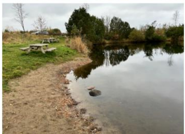
Ansøgers indsendte fotos fra besigtigelse af det berørte område den 8. november 2024