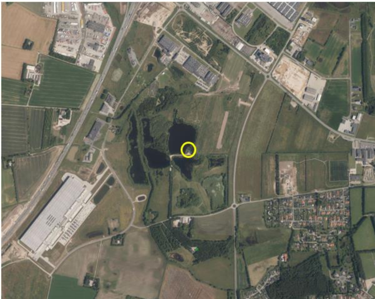
Den berørte del af ejendommens placering i landskabet vist med gul cirkel på luftfoto fra 2024