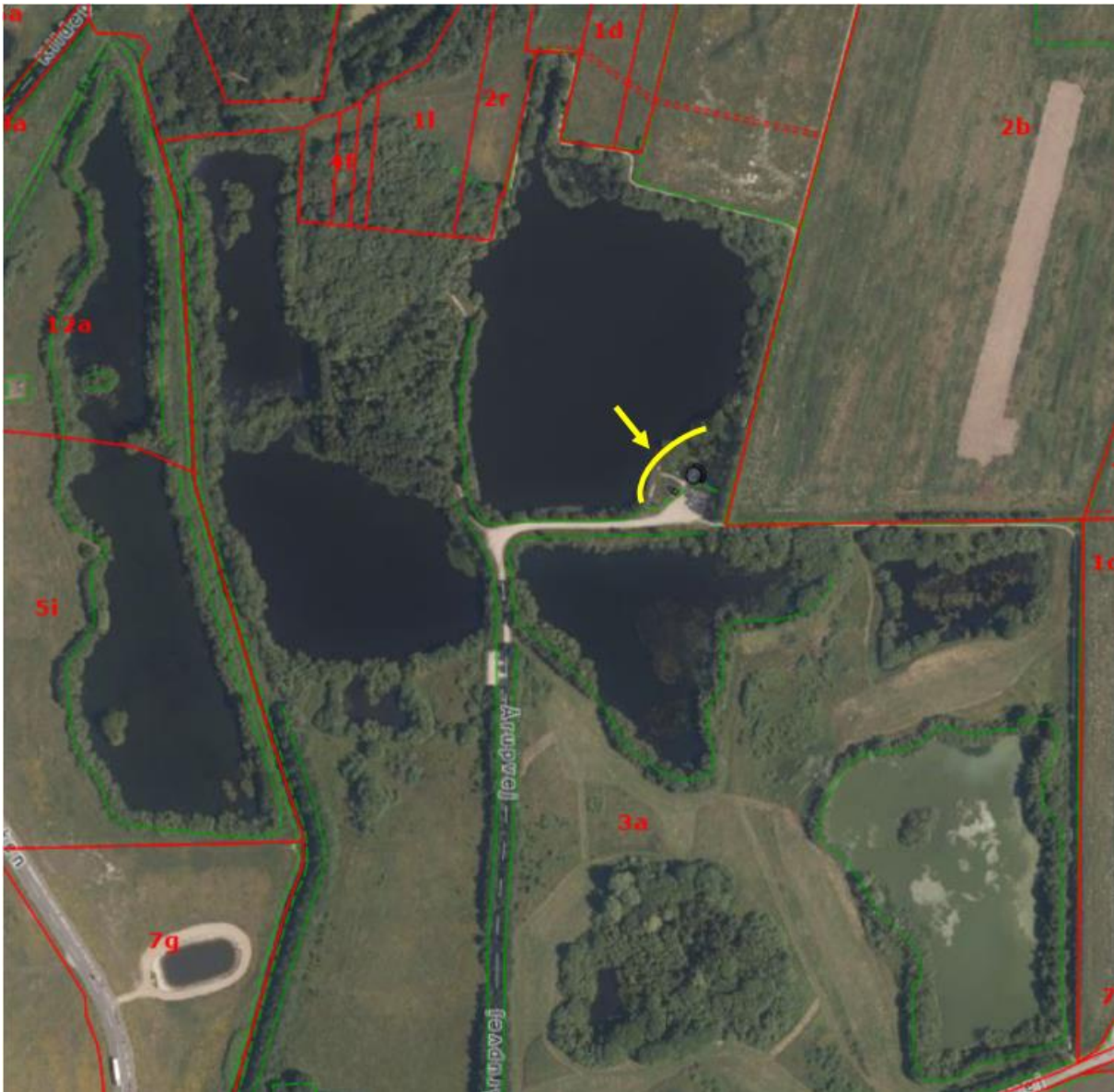
Den omtrentlige placering af det ansøgte vist med en gul streg på luftfoto fra 2024