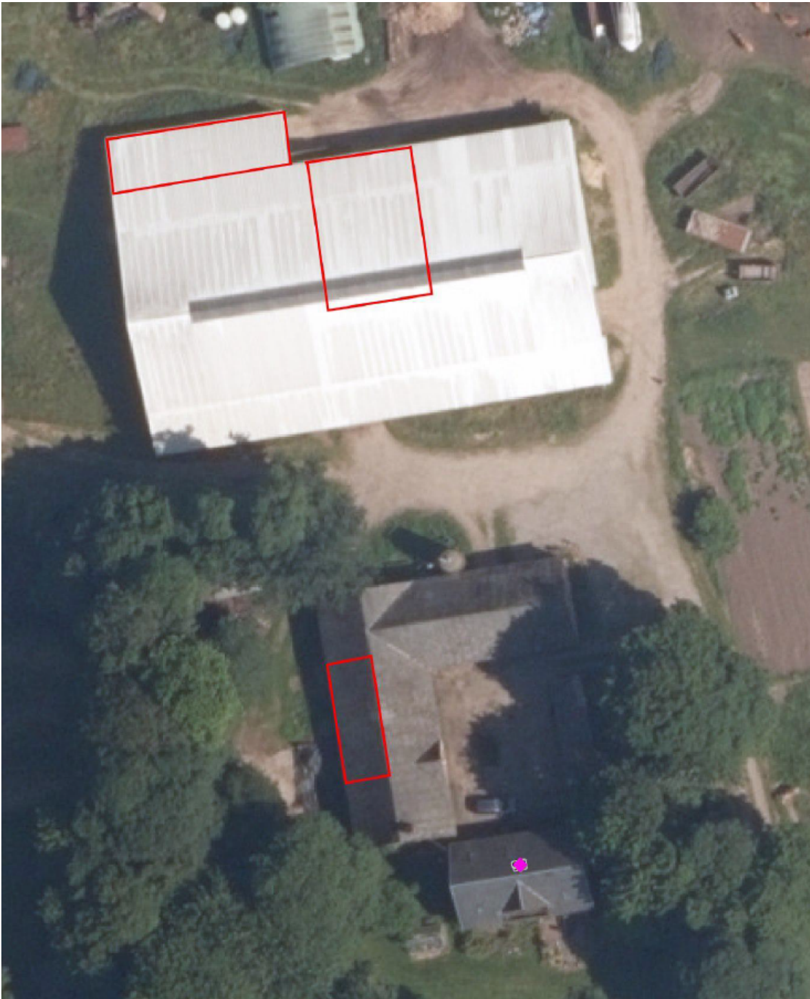
Figur 1. Produktionsarealer på ejendommen.

Det nederste markerede areal er fem hestebokse på 55 m 2 i Bygning 2 (jf. BBR), det øverste markerede areal til højre er et 169 m 2 dybstrøelsesareal til køer og en tyr i Bygning 7 (jf. BBR), og det øverste areal til venstre er resterende 71 m 2 til kalve i Bygning 7 (jf. BBR).