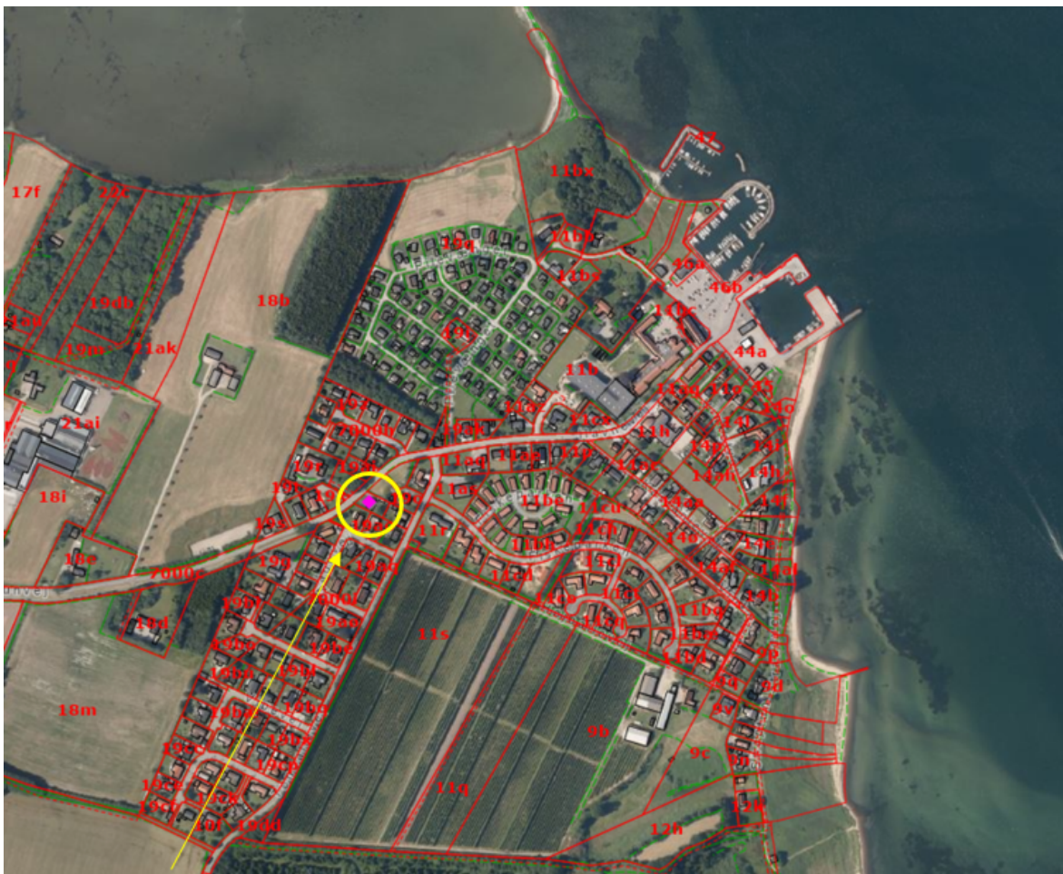
Ejendommens placering i landskabet vist på luftfoto fra 2024.

Afgørelsen vil så vidt muligt blive offentliggjort torsdag den 8. oktober 2024 ved annoncering på Hedensted Kommunes hjemmeside