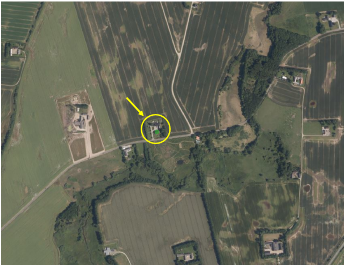
Ejendommens placering i landskabet vist med gul cirkel på luftfoto fra 2024

Afgørelsen vil så vidt muligt blive offentliggjort tirsdag den 1. oktober 2024 ved annoncering på Hedensted Kommunes hjemmeside