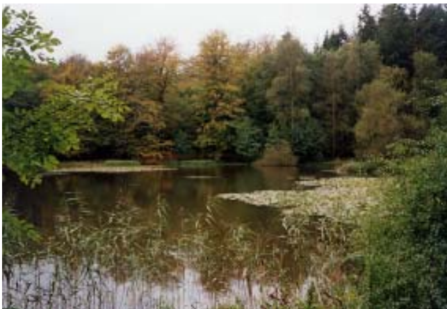
Elverdammen ved Søholt

Fra Holmsbakkevej går ruten mod nord ad en skovsti gennem en bevoksning af bøg. Øst for vejen ses et lille område, der allerede har været urørt i mange år. Det ses på de døde og døende træer med mange spættehuller og svampe. Om 100 år vil den nye naturskov, måske ligne dette lille skovstykke. Turen kan nu afsluttes ved enten at gå gennem den dyrkede skov til p-pladsen eller fortsætte tilbage til Elverdam.