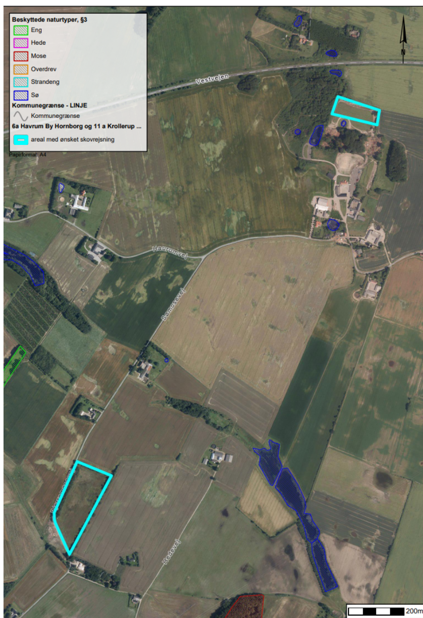
Figur 4. Registreret §3 natur i tilknytning til arealerne hvor der ønskes skovrejsning