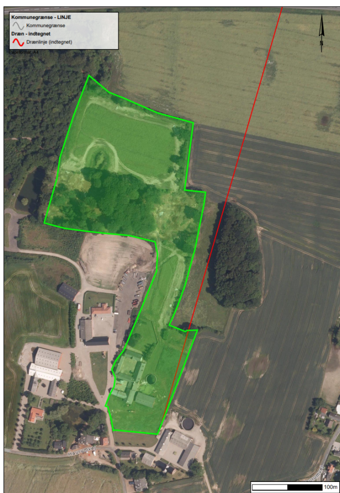
Figur 8. Der er registreret drænledning ved arealet på mat.nr. 6a Haurum By, Hornborg. Kortet er vejledende.

Der er ikke udarbejdet screening for det påtænkte læhegn, men der gøres opmærksom på, at der er registreret en drænledning i området hvor der ønskes læhegn. Kortet er vejledende og drænrørene kan godt ligge væsentlig forskudt i forhold til hvad der ses på nedenstående kort, figur 7.