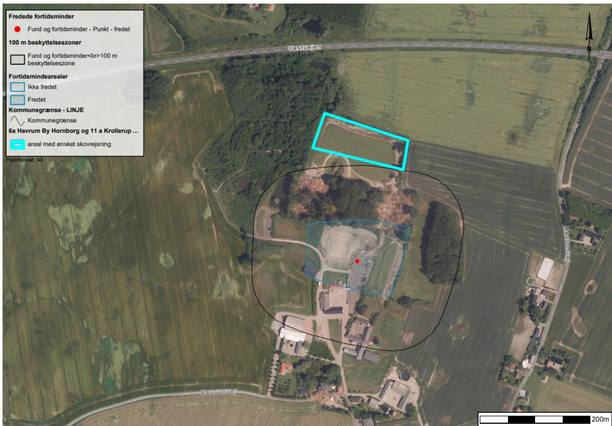
Figur 5. Det ønskede skovrejsningsareal på matr.nr. 6a Haurum By, Hornborg, ligger indenfor et lille område af fortidsmindebeskyttelseslinjen af fortidsminde "Havrum Slot", fredningsnummer. 29115.

Bygherre har mulighed for at bede det lokale kulturhistoriske museum om en udtalelse forud for anlægsarbejdets opstart jf. Museumslovens § 25.