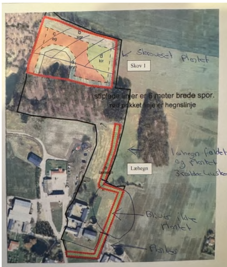
Figur 2. Ansøgers modificerede kort vedrørende skovrejsning på matrikel nummer 6a Havrum By, Hornborg, indsendt 18.3.2025.

Efter tilbagemelding fra Vejle Museerne vedrørende fortidsmindebeskyttelseslinjen på matr. Nr. 6a Havrum By, Hornborg, er kortet nu modificeret så der rejses skov uden for linjen, se ansøgers modificerede kort på figur 2.