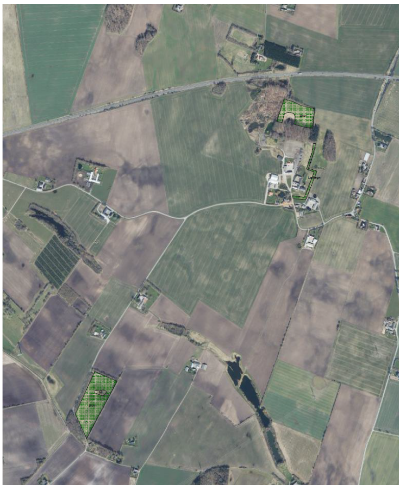
Figur 1. Kort over oprindeligt ønsket skovrejsningsområde. Kortet er udarbejdet af ansøger.

Ansøgningen er sendt af Skovdyrkerne Syd, på vegne af TM Nedbrydning ApS, der ønsker et område på ca. 4,5 ha beplantet.