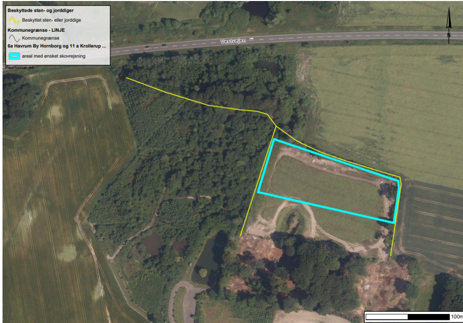
Figur 6. Beskyttede sten- og jorddiger ved matr.nr. 6a Haurum By, Hornborg.

Da digerene allerede er bevoksede med gamle træer, vil overskygning i dette tilfælde ikke være af betydning. Hedensted Kommune vurderer derfor, at der kan gives tilladelse til rejsning af skov med indtil 2 meter til diget, under den forudsætning, at de træer der sættes, ikke ødelægger diget med deres rødder. Som udgangspunkt går rødderne lige så langt ud, som kronekanten af trækronen. Kun mindre træer og buske vil derfor være muligt.