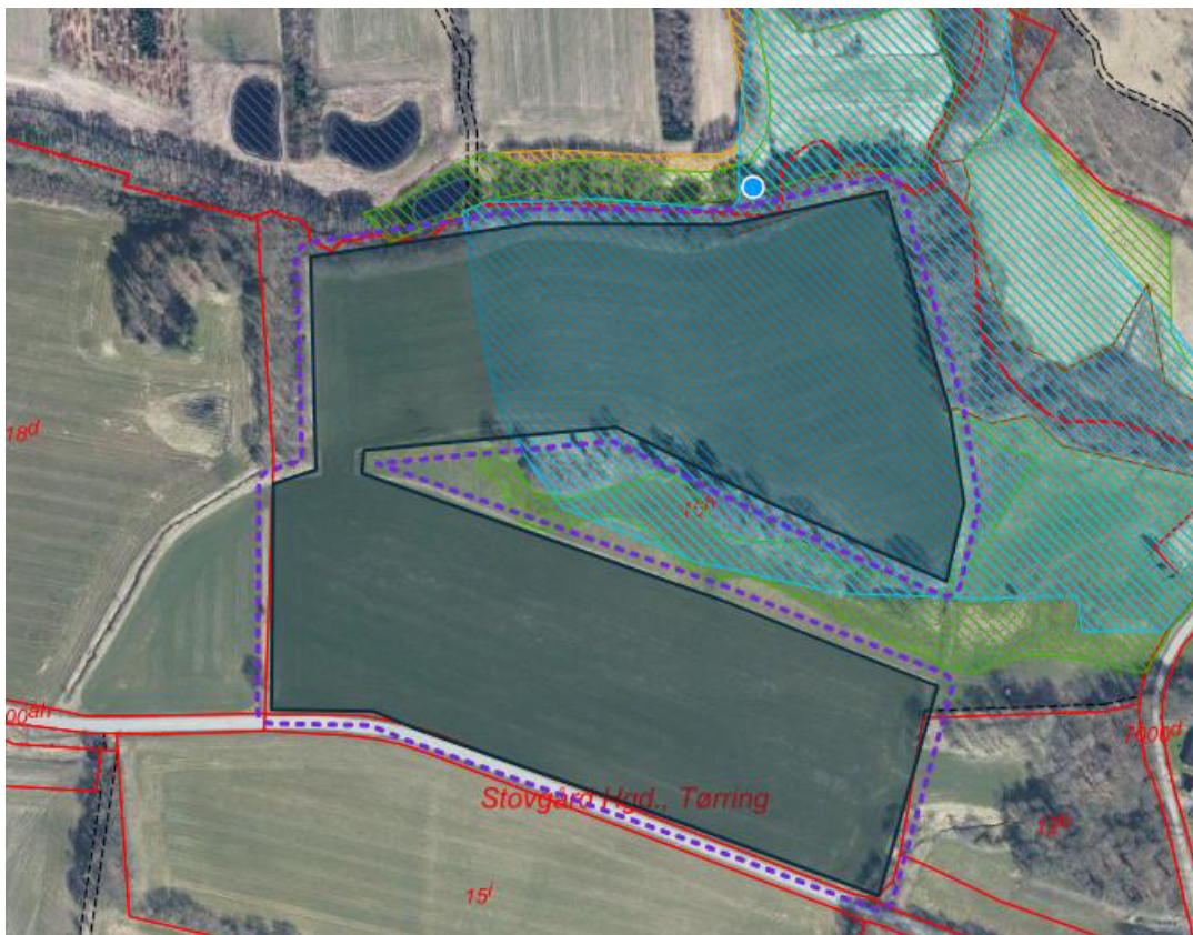
Figur 1. Kort over ønsket skovrejsningsområde. Kortet er udarbejdet af Kirkby Invest A/S.

Ansøgningen er sendt på vegne af Kirkby Invest A/S, der ønsker et område på ca. 9,5 ha beplantet.