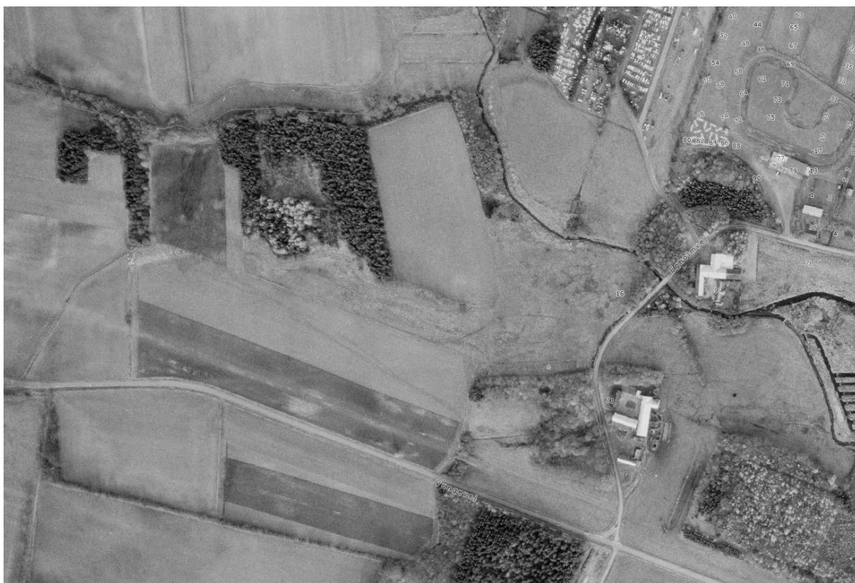
Figur 6. Luftfoto fra 1972, der viser den del af det fredede område, der ikke er tilplantet med skov, og som ønskes friholdt for skov jvf. Fredningen "Gudenåens kilder".