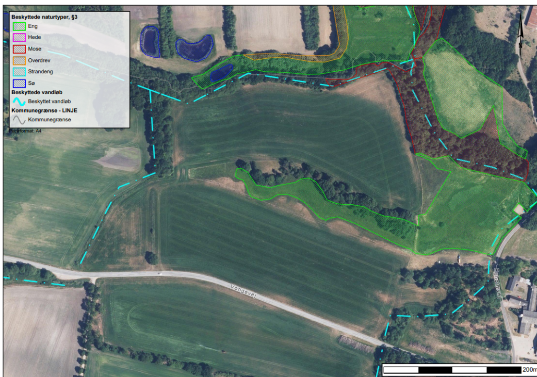
Figur 3. Registreret §3 natur i tilknytning til arealerne hvor der ønskes skovrejsning

Vi gør opmærksom på, at vi ønsker at man tilgodeser naturen i området, ved at undgå træarter som ikke spreder sig eksplosivt, f.eks. bævreasp.