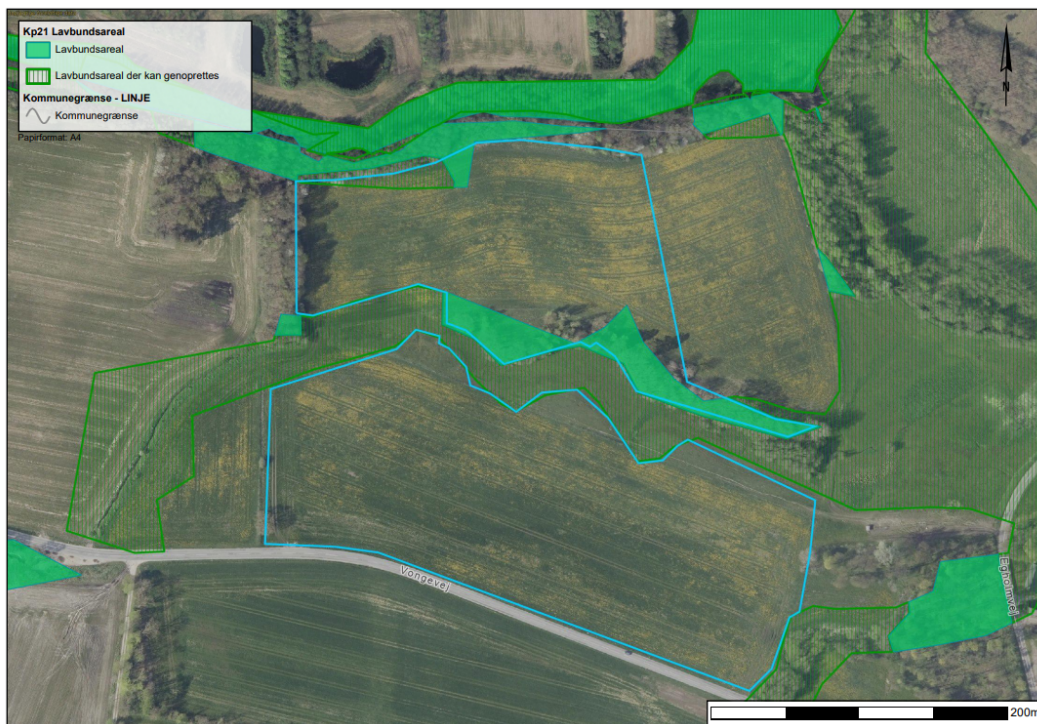
Figur 4. Lavbundsarealer