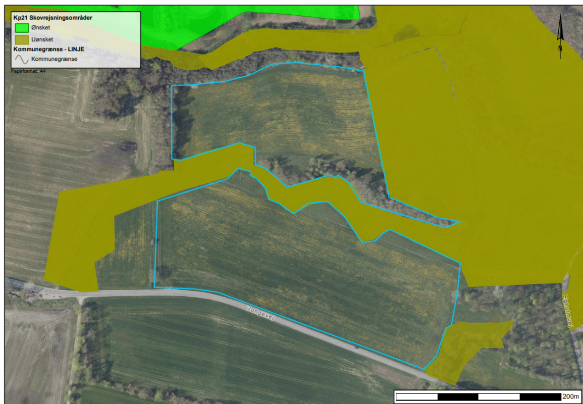
Figur 2. De omtrentlige linjer er angivet på kortet herover med blå linje. Arealerne udgør tilsammen ca. 8 ha.

De 1,5 ha med skovrejsning uønsket, er ikke medtaget i denne vurdering, da der ikke kan gives dispensation til skovrejsning her. En eventuel dispensation skal søges ved Fredningsnævnet for Midtjylland, østlig del.