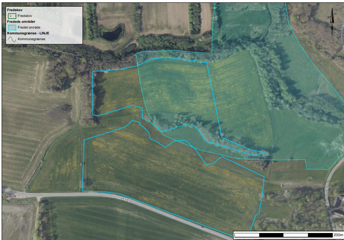
Figur 5. Fredningen "Gudenåens kilder" rækker ind i området hvor skovrejsningen vil etableres.